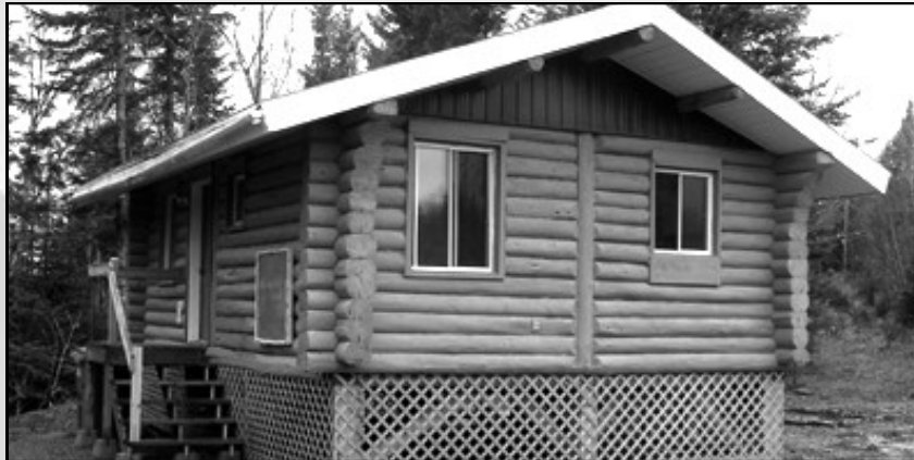
Chalet du Débarcadère

Du côté chasse, nous avons pu louer les 7 zones rendues disponibles selon ce nouveau mode afin de satisfaire des groupes voulant se prévaloir de tous les types de chasse sur une base annuelle et sur le même territoire année après année. Chacun des 28 forfaits de chasse de l'original a trouvé preneur. Les 10 forfaits pour la chasse du cerf de Virginie ont facilement trouvé preneurs aussi. Le taux de succès pour l'original en 2013 est de 91 %, soit un taux fort intéressant pour les chasseurs. Tous les forfaits de chasse sont vendus pour la saison 2014.